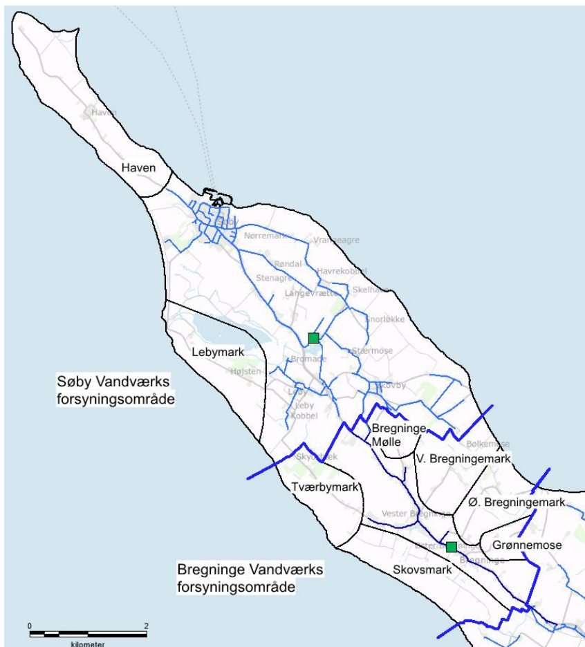
Figur 4 Det område, hvor ejendomme umiddelbart kan blive forsynet med vand fra vandværket kaldes "det naturlige forsyningsområde". Indenfor Bregninge – og Søby Vandværks forsyningsområde er der områder, hvor vandværkerne endnu ikke har udlagt vandledninger. Disse områder, der ligger udenfor det naturlige forsyningsområde, er vist med en sort afgrænsning og et navn på ovenstående kort.