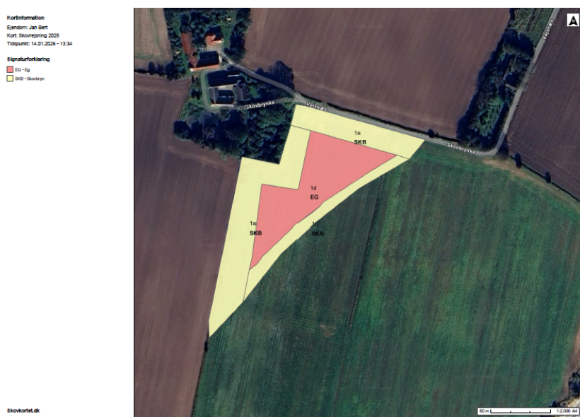
Figur 2: Oversigtskort over skovplan for skovrejsningsprojekt.

Den 15. januar 2026 modtog Svendborg Kommune en forhåndsansøgning om privat skovrejsning på matr.nr. 2, Gråsten By, Rise ved Skovbrynke 1, 5970 Ærøskøbing. Se oversigtskort for skovplan herunder: