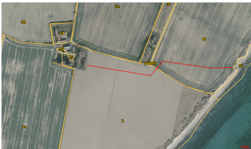
Figur 4: Oversigtskort for omtalte dræn på ejendommen. Rød linje indikerer ca. placering for drænledning mod kysten. Orange linje viser beskyttede sten- og jorddiger. Gule linjer viser matrikellinjer

Gennem ejer af ejendommen, samt gamle drænkort, er Svendborg Kommune bekendt med et dræn på ejendommen som ligger inden for ansøgte skovrejsningsprojekt. Det løber fra nuværende bevoksning umiddelbart sydøst for ejendommen på matr.nr. 2, Gråsten By, Rise og mod øst. Herefter krydser drænet et beskyttet dige og krydser over i dræn på matrikel 4f, Gråsten By, Rise, inden udløb i skrænten (figur 4). Hverken ejer af nabomatrikel mod nord (3e, Gråsten By, Rise) eller Svendborg Kommune er bekendt med øvrige dræn inden for skovrejsningsprojektet. For at sikre drænets funktionalitet holdes der et 6 meter bredt beplantningsfrit bælte over drænet (3 meter på hver side af drænmidte).