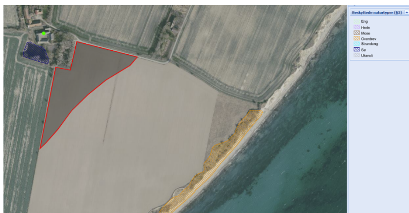
Figur 3: Oversigtskort for ansøgte område for skovrejsning (Rød markering). Beskyttet sø (blå skravering) og beskyttet overdrev (orange skravering). Grøn prik indikerer adressen Skovbrynke 1.

Arealet, hvor der ansøges om skovrejsning, er i dag dyrket agerjord. Arealet har gennem årene været benyttet til forskellige afgrøder for eksempel vårbyg og vårhavre.