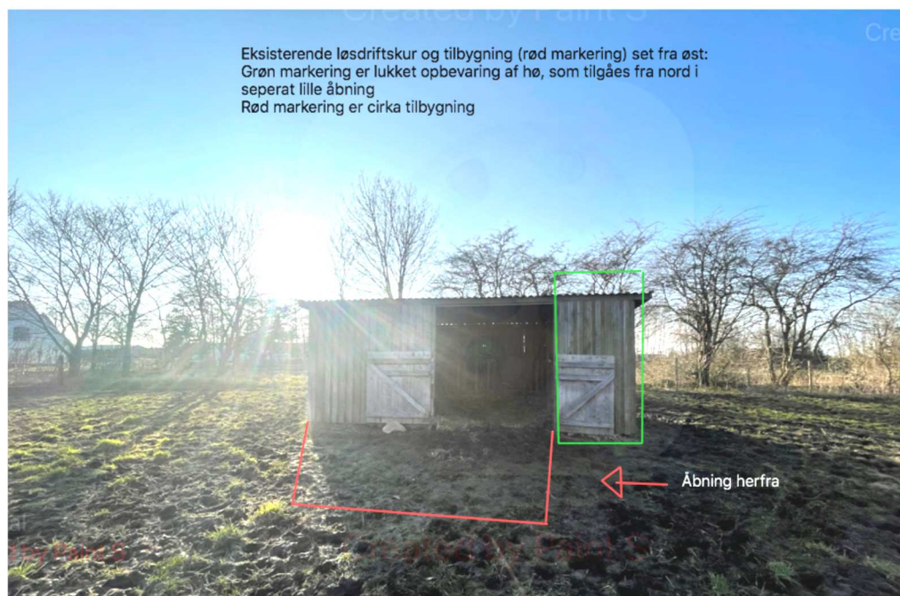
Eksisterende bygning set fra øst

Højden på bygningen er maksimalt 2,60 meter.