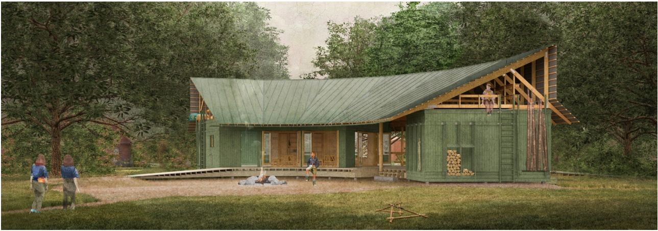
Figur 1 Billede af prototype på spejderhytte, der opføres

I forbindelse med opførelsen nedrives eksisterende spejderhytte på 46 m 2 samt 2 småbygninger på henholdsvis 20 m 2 og 10 m 2 .