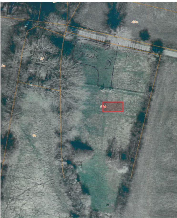
Figur 2 Skitse over placering af hytte og vendeplads

På matr.nr. 11d Kraghæs, Marstal indrettes et område til holdeplads for biler. Indretningen udføres i grus, plastarmering eller lign. Der etableres ikke tæt underlag. Se nedenstående skitsetegning.