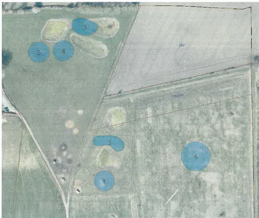
Figur 1. Oversigtskort over matr.nr. 1a Landsbyen, Marstal. De blå skraveringer angiver placeringer for de ansøgte søer.

Svendborg Kommune opfordrer alle til at skrive sikkert via Digital post. Derfor bør du aldrig sende fortrolige personhenførbare oplysninger (CPRnr, helbreds- og økonomiske oplysninger) i en almindelig mail. Læs mere: https://www.svendborg.dk/om-kommunen/digital-post-og-selvbetjening