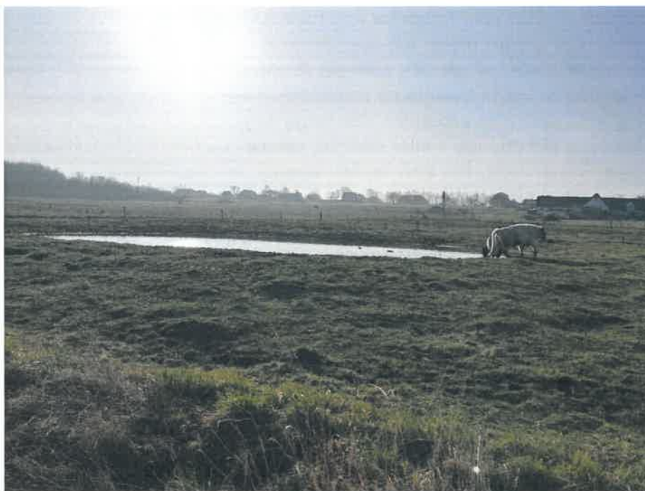
Figur 3. Billede fra besigtigelse. En af de normalt tørre søer ses her med vand.