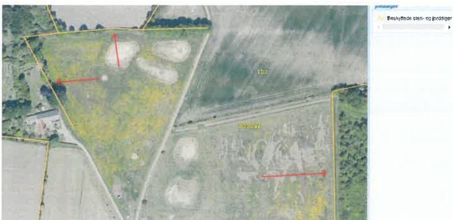
Figur 5. Oversigt over beskyttede sten- og jorddiger som er angivet med røde pile.

Nord og vest for placeringerne 3, 4 og 5 og øst for placeringerne 1, 2 og 6 (figur 1) løber der beskyttede sten- og jorddiger. Der skal holdes afstand til de beskyttede diger angivet på kortet i figur 5, og der må ikke lægges jord på digerne.