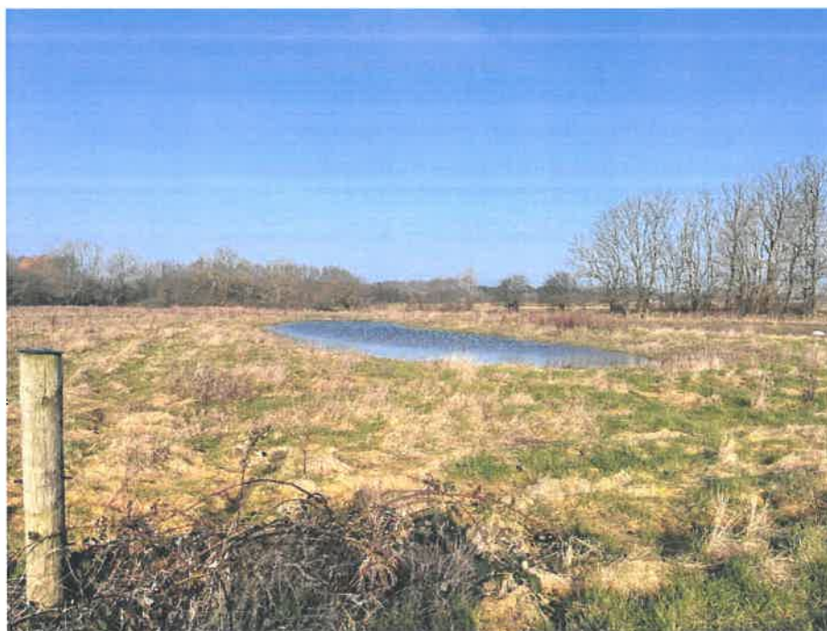
Figur 4. Billede fra besigtigelse. En af de normalt tørre søer ses her med vand.