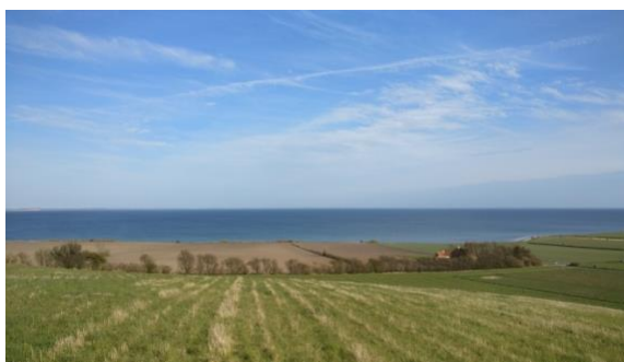
Vue mod nordøst og øst: I billedet Gråsten Skanse, Havsmarken jernalder og vikingetid.