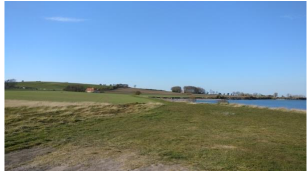
Rodet og uindbydende indtryk ved p-pladsen og flot vue mod Havsmarken og Lindsbjerg.

- Eske / Kalvehave: Kulturlandskab med spor af bosættelse fra jernalder og vikingetid. Foreslås skiltet og visualiseret fra Lindsbjerg, se nedenfor, samt med "indkørselsskilt" svarende til det ved p-pladsen ved Drejet. Et sådant kunne placeres på Lindsbjergvej.