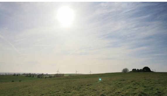
Vue mod sydøst og øst: Stenalder på bakke overfor Lindsbjerg, ryddede gravhøje. Jernalder – vikingetid i Kalvehave og dysserne på Lindsbjerg fra stenalderen.