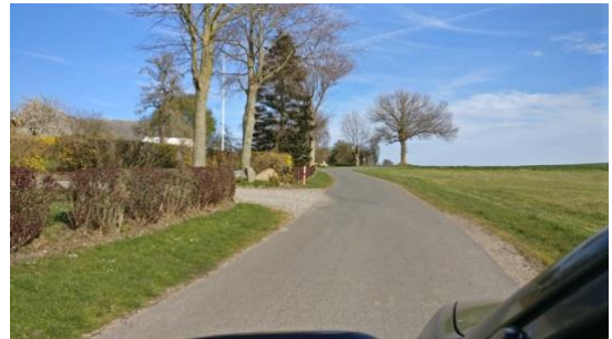
Skiltning på Brovej mod Sankt Alberts og Lindsbjerg. Området i Kalvehave ved stien mod dysserne.