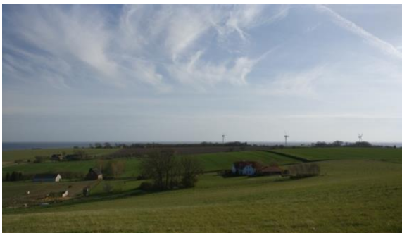
Vue mod sydøst og syd: I billedet Vikingetidshandelspladsen, Sct. Alberts og Eske.