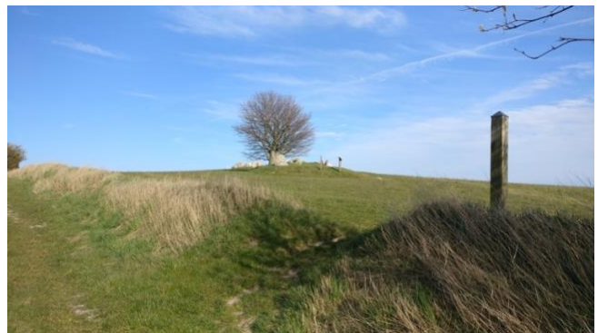
Området ved sti op til Lindsbjerg, ingen parkeringsmuligheder. Gennemgang i marskel fra den smukke og velholdte sti op til dysserne på Lindsbjerg.

- Lindsbjerg-dysserne: Dysser fra bondestenalderen. (I dag tilstrækkeligt skiltet)