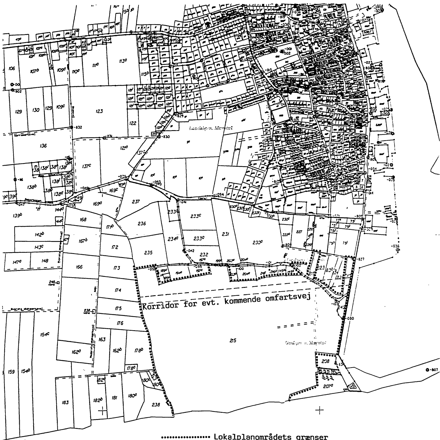
Kopi af matrikelkortet i mål 1 : 8.000